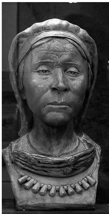
«Сарматская бабушка». Реконструкция облика сарматской женщины из Кичигинского холма в Увельском районе Челябинской области. IV век до нашей эры

В середине первого тысячелетия до нашей эры здесь бурлила жизнь племён, называемых то саками, то савроматами, то аорсами, то сираками, то язигами, то роксоланами, и все они при всех различиях, что существовали между ними, относились к единой степной культуре, известной под названием «скифо-сибирское культурно-историческое единство...» 9 .